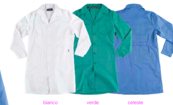
bianco verde celeste

Tessuto: 65% Poliestere 35% Cotone (200 g/m2)