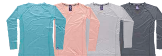
turchese pesca grigio chiaro nero

Taglie: S, M, L, XL, XXL, 3XL Tessuto: 93% Poliestere 7% Elastan (155 g/m2)