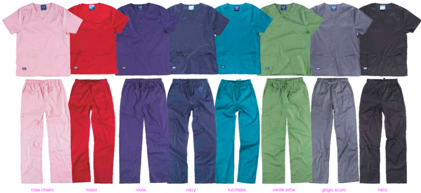
rosa chiaro rosso viola navy turchese verde erba grigio scuro nero