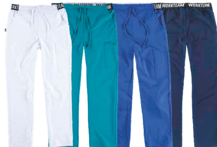
bianco turchese royal navy