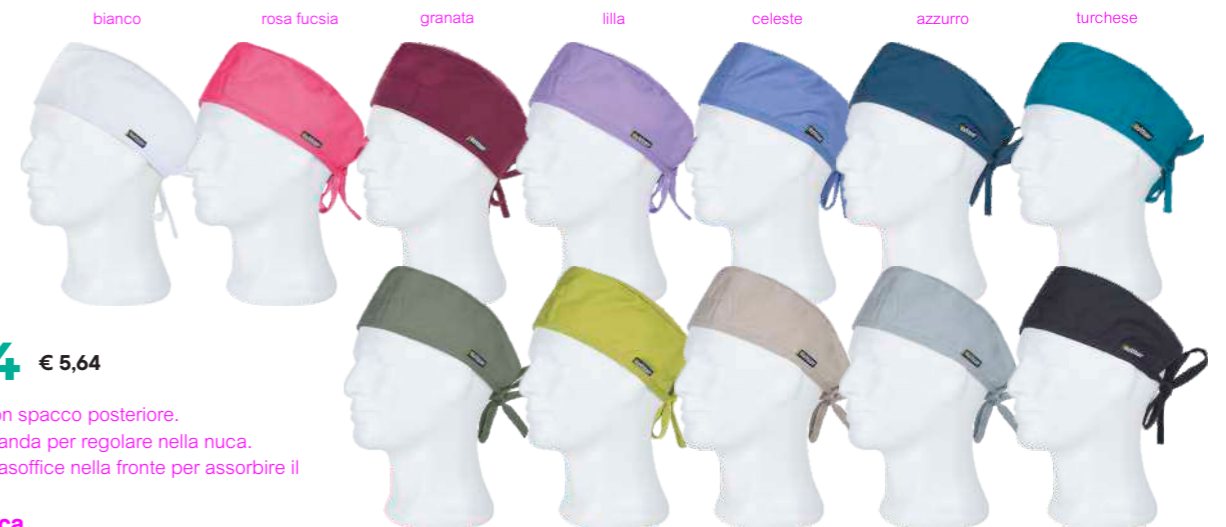
bianco rosa fucsia granata lilla celeste azzurro turchese