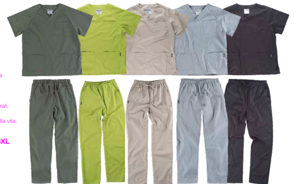
verde oliva verde mela grigio talpa grigio nero

Taglie: XS, S, M, L, XL, XXL, 3XL Tessuto: 80% Poliestere 20% Cotone (150 g/m2)