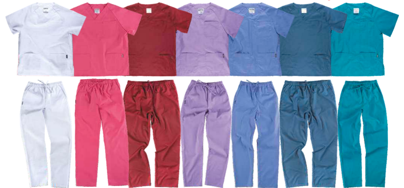
bianco rosa fucsia granata lilla celeste azzurro turchese

Taglie: 36, 37, 38, 39, 40, 41, 42, 43, 44, 45 Composizione: Poliestere/Elastan/Cotone/PU