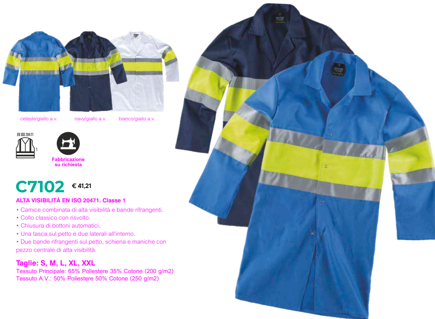
celeste/giallo a.v. navy/giallo a.v. bianco/giallo a.v.

Tessuto: 65% Poliestere 35% Cotone (160 g/m2)