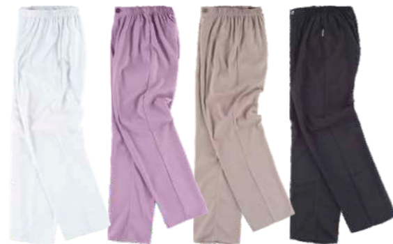
bianco viola beige nero