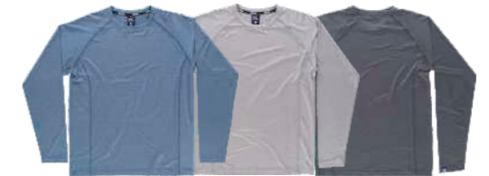
azzurro grigio chiaro nero