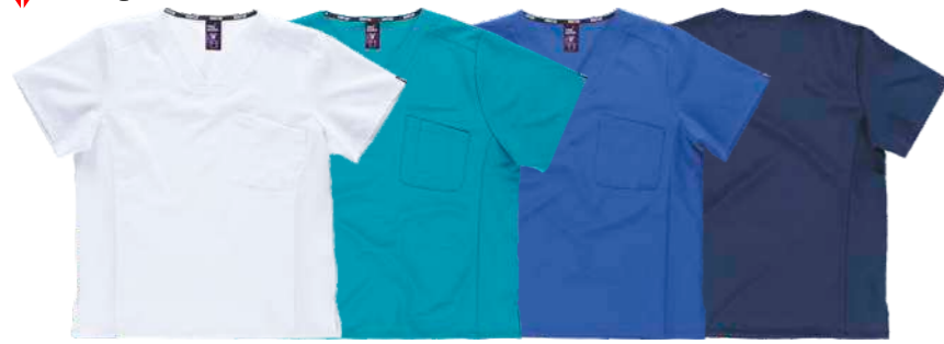
bianco turchese royal navy