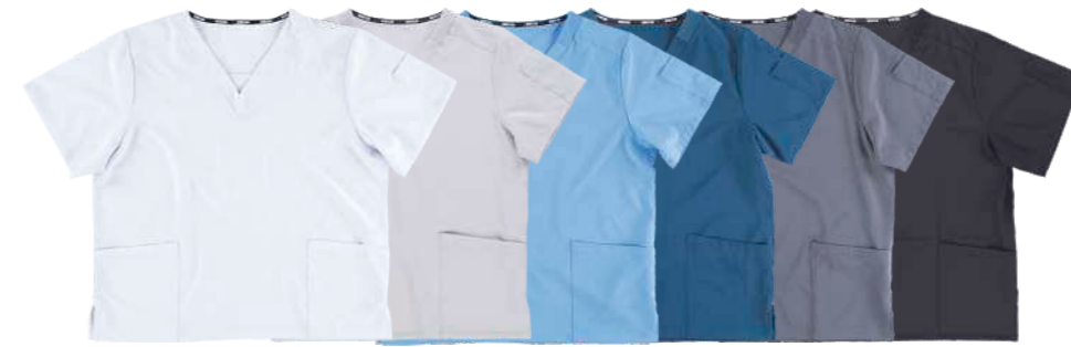
bianco grigio chiaro celeste azzurro grigio nero