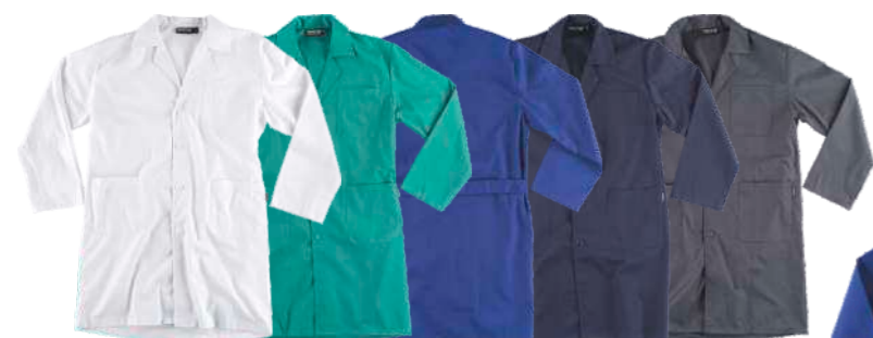
bianco verde royal navy grigio