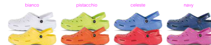
bianco pistacchio celeste navy