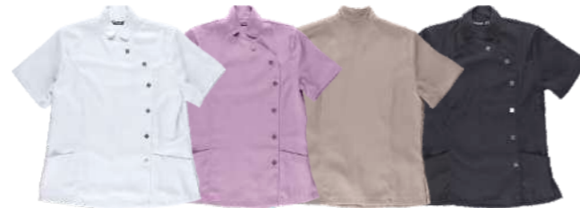
bianco viola beige nero