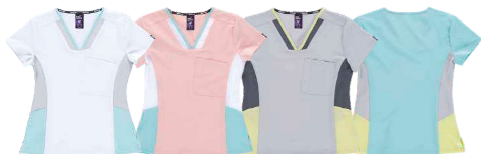
bianco/grigio chiaro/ turchese chiaro