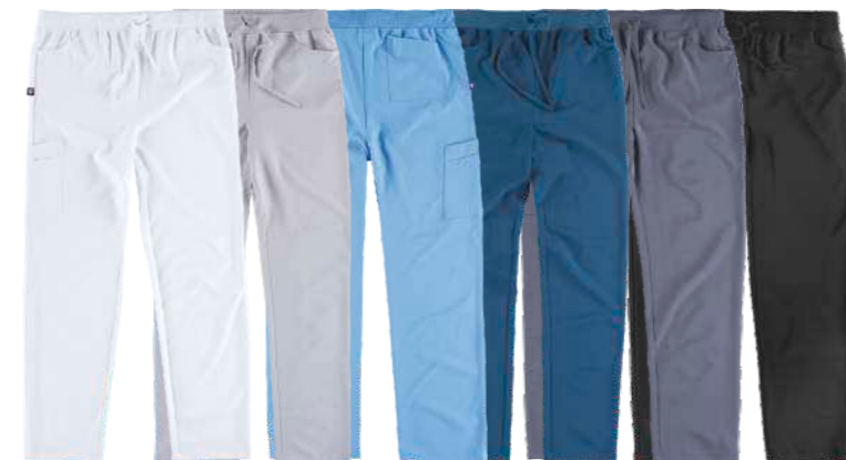
bianco grigio chiaro celeste azzurro grigio nero